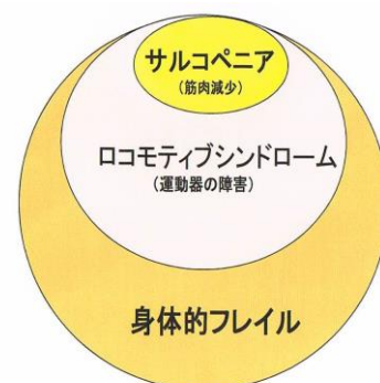
サルコペニア、ロコモティブシンドロームの位置関係

今回の講座で 第2弾【フレイルを吹き飛ばすパワーと情報】 をお持ち帰り頂く講座です。お誘い合わせの上ご参加下さい。