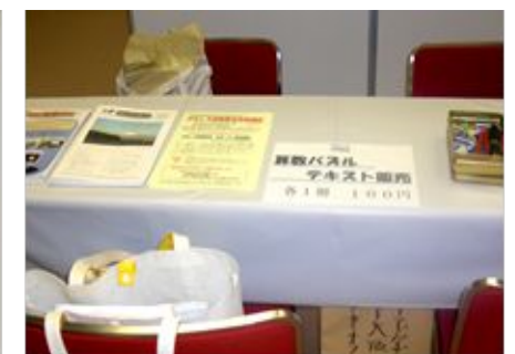
おもしろ算数教室「体験コーナー」