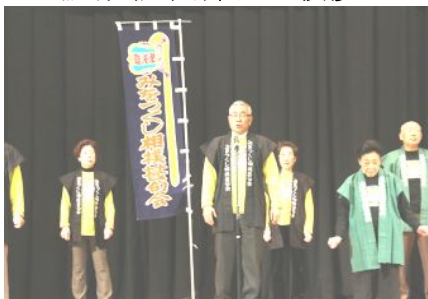
みおつくし相撲甚句会