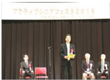
大阪府 植木課長のご挨拶

元気なシニア世代など前回は上回る約1,000人(協会発表)の来場者があり賑わっていた。