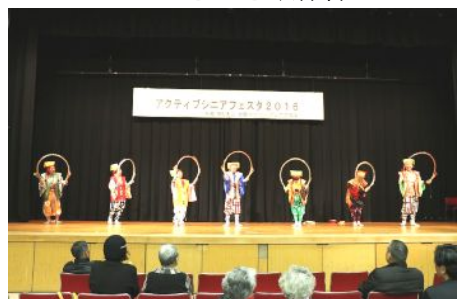
恵比須げんき会「南京玉すだれ」