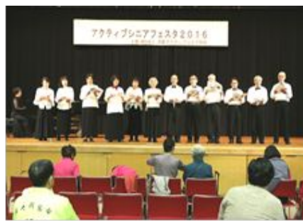
SA 国際ハーモニシー合唱団