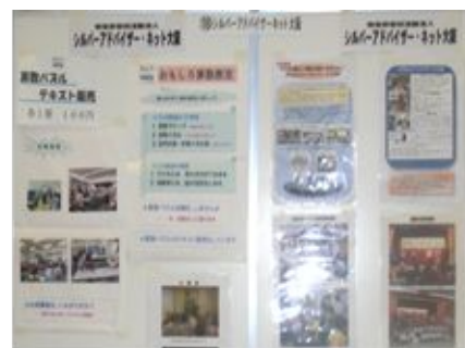
SA・ネット大阪「展示パネル」