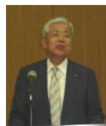
[報告：奥谷副理事長]