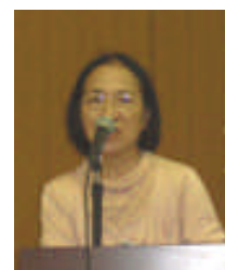
[ 報告：二葉理事 ]

また、初めて参加なさった方でも「次はいつ来てくれるの?」と、お声をかけて下さいまして、うれしく思い、また来たいと思いました。