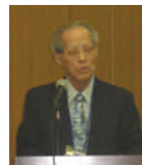
[ 報告：三田理事長 ]